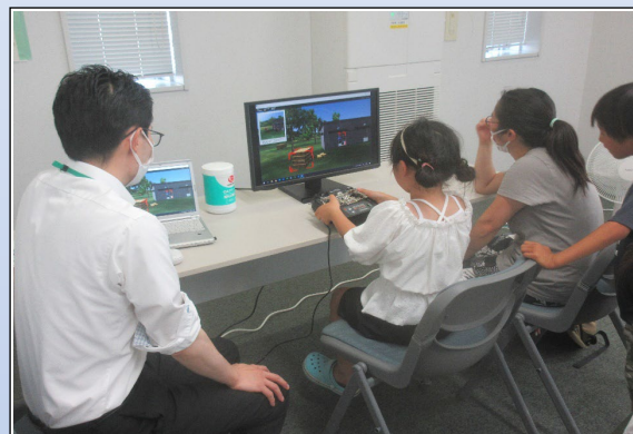
ドローンシミュレーター

日時：2024年7月20日（土） 10時～15時（受付時間9:50～14:30）