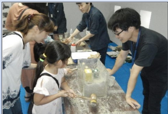
液状化現象を見てみよう！